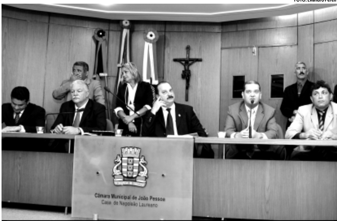
Vereadores de João Pessoa têm uma extensa pauta de matérias para analisar em suas comissões temáticas

Ainda abordando o tema do painel, o senador defendeu que as duas condições básicas para ser eleito foram conquistadas, a principal diz respeito ao fato dele ter sido eleito com a maior votação, mais de um milhão de votos, e a segunda foi resolvida após o provimento do recurso que pedia o registro da sua candidatura, que foi deferido pelo ministro Joaquim Barbosa. "Portanto o que falta para dar eficiência à decisão tomada pelo STF?", questionou.