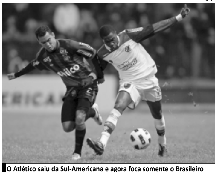
O Atlético saiu da Sul-Americana e agora foca somente o Brasileiro