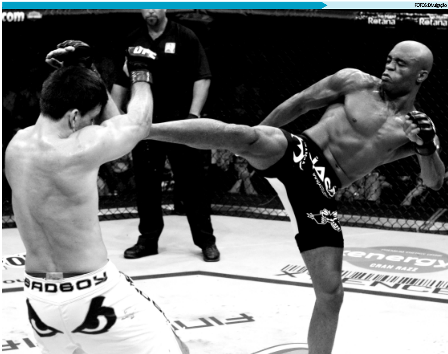
Aguardada com grande expectativa, a luta entre Anderson Silva e Yushin Okami será a principal da noite; o "Spider Silva" é o maior ídolo do MMA no Brasil

O campeão dos médios do UFC apareceu vestido com roupas do Corinthians e