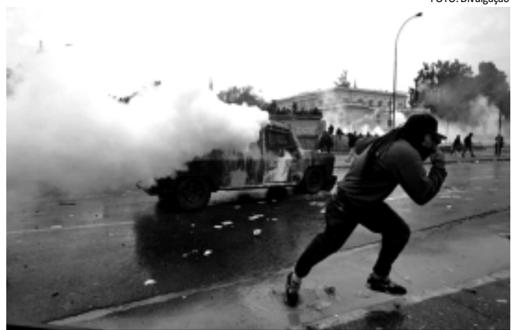
Os protestos terminam em confrontos entre policiais e manifestantes

IRENE (AE) - Os ventos máximos sustentados de Irene estavam em 175 quilômetros por hora ontem. O Centro Nacional de Furacões (NHC, na sigla em inglês), porém, afirmou que o fenômeno pode ganhar mais força, aproximando-se do limite entre as categorias 2 e 3, pouco antes de chegar à costa da Carolina do Norte.