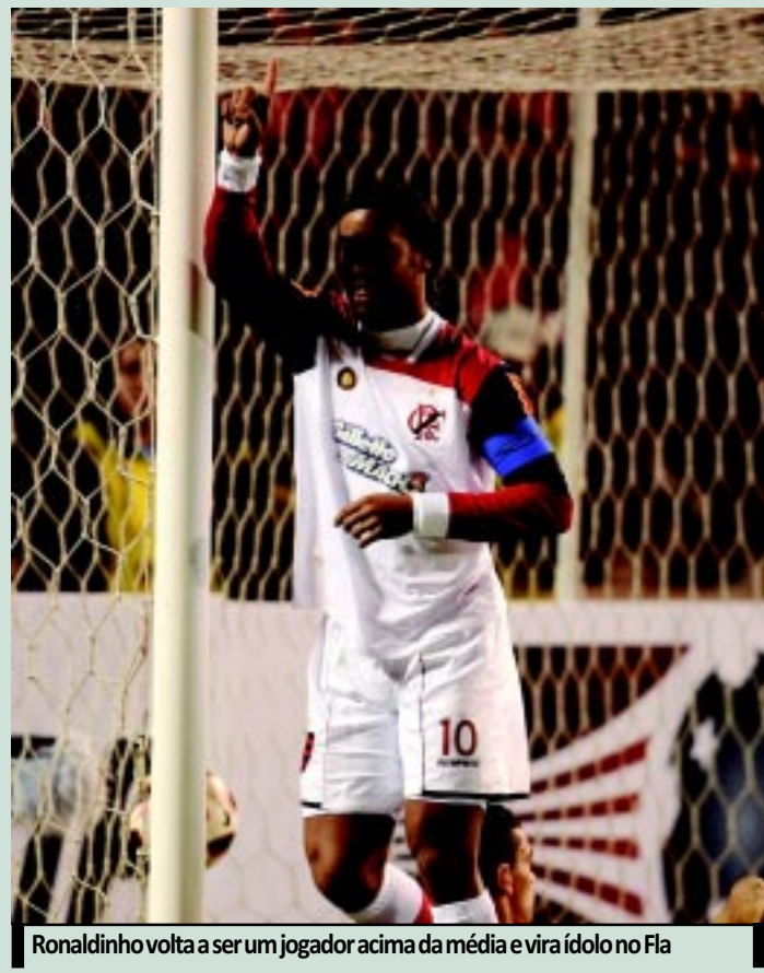
Ronaldinho volta a ser um jogador acima da média e vira ídolo no Fla