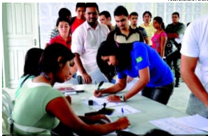
Inscrições para vestibular da UFPB podem ser feitas até amanhã

Mais de 146 mil alunos devem estar aptos a concorrer as 16.643 vagas oferecidas pelas Universidades Federal da Paraíba, Federal de Campina e Estadual da Paraíba. São 31.200 inscritos na UEPB e pelo menos 115 mil pré-inscritos nas federais da Paraíba e de Campina. As inscrições da UFPB podem ser feitas até amanhã e o pagamento até segunda. PÁGINA 10