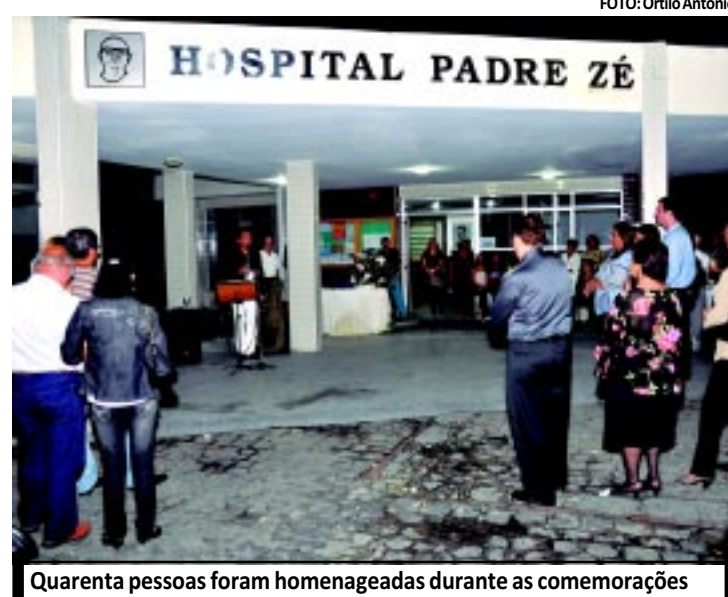
Quarenta pessoas foram homenageadas durante as comemorações