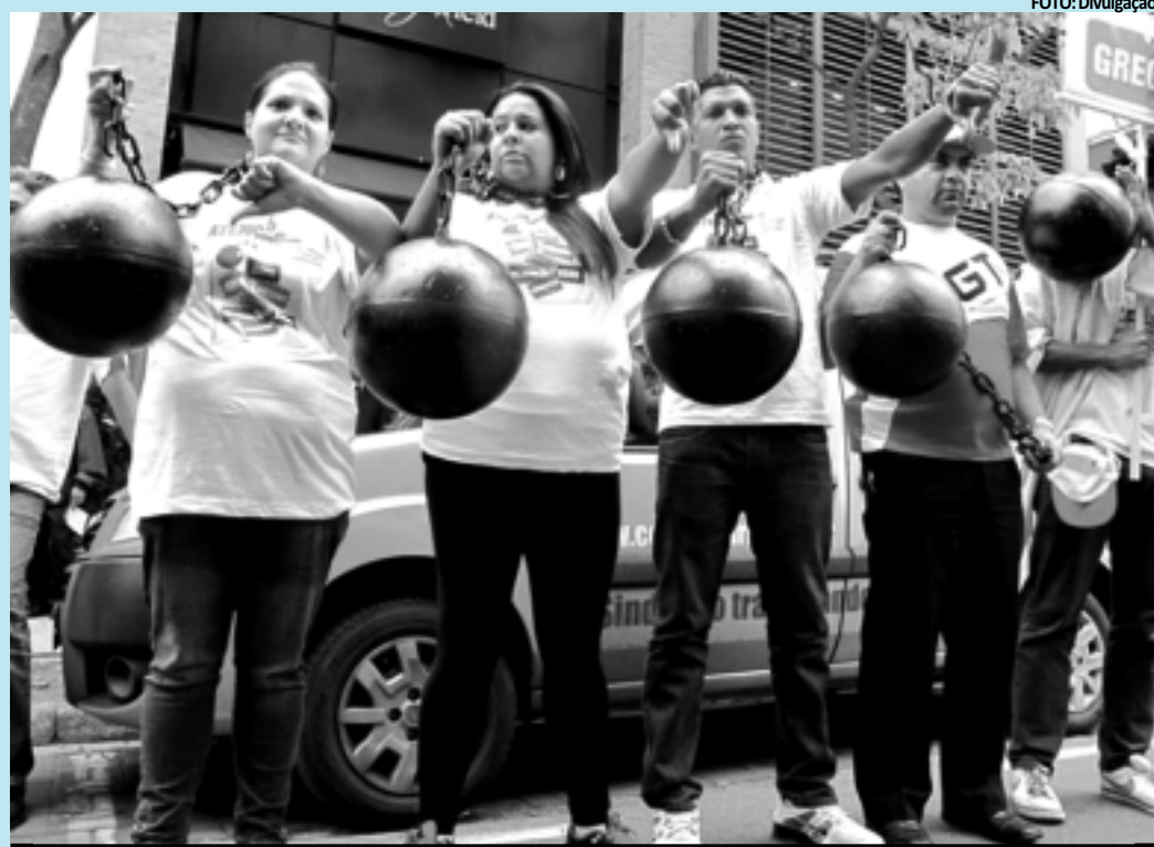
Marcas que estariam vendendo roupas produzidas em condições semelhantes à escravidão foram criticadas