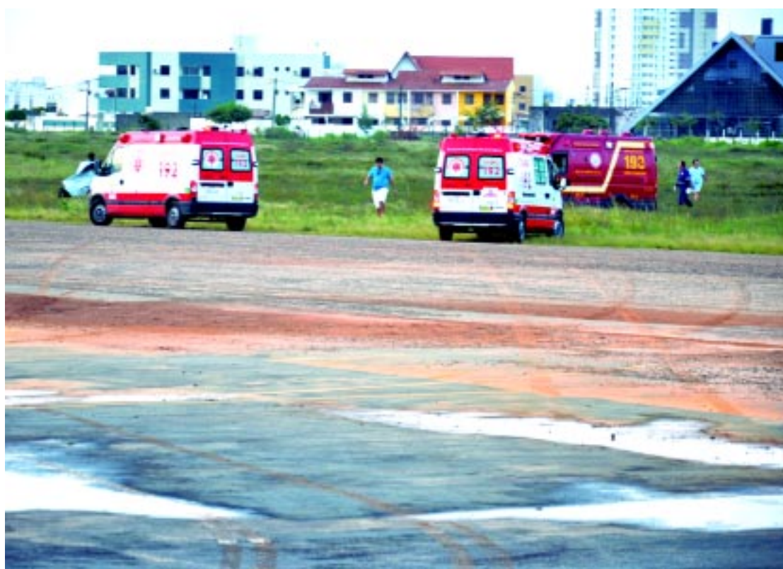
NA CAPITAL | Ultraleve cai no Aeroclube da Paraíba e deixa piloto ferido; esse foi o segundo acidente em oito meses PÁGINA 8

O governador Ricardo Coutinho recebeu os diretores da Fiat para uma reunião e abriu o processo de diálogo para a atração de investimentos em torno da instalação do complexo industrial da montadora que será construída em Goiana, divisa com a Paraíba. O Governo também criou um comitê para aproximar o Estado das empresas que integram a cadeia alimentadora da Fiat e atrair indústrias para a Paraíba. Ricardo Coutinho informou que o Estado está adotando um regime tributário idêntico ao que Pernambuco adotou. PÁGINA 4