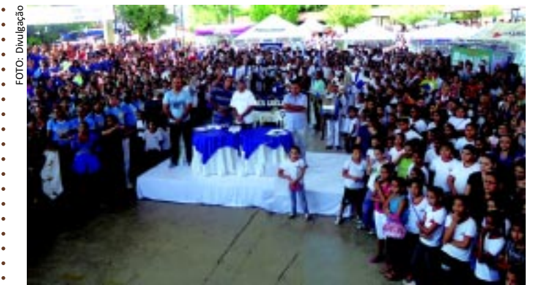
[FOTO&LEGENDA] A Secretaria de Estado da Educação está promovendo a I Feira Cultural Resgatando Valores Construindo a Paz. Ontem, o evento aconteceu no ginásio da Escola Dom Moisés Coelho, em Cajazeiras. A Feira integra o plano "Paraíba Faz Educação"