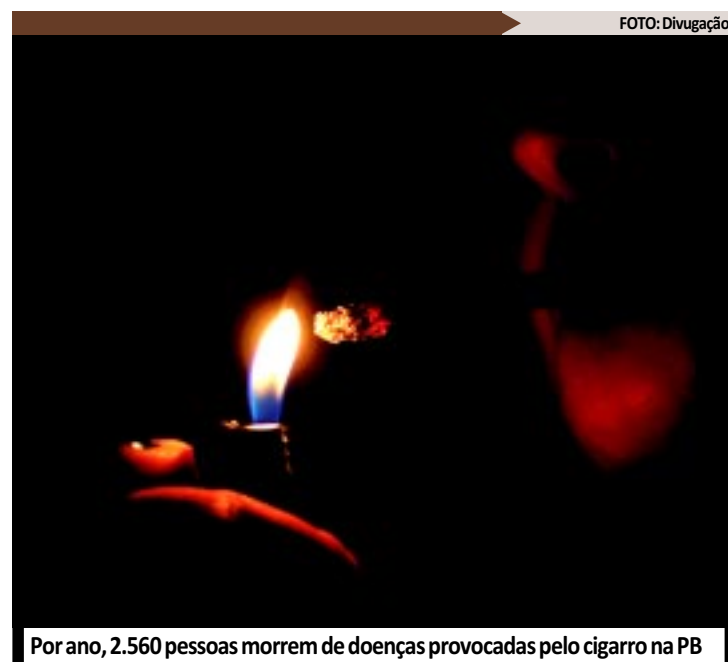
Por ano, 2.560 pessoas morrem de doenças provocadas pelo cigarro na PB

Mas este trabalho não se resume apenas ao Dia Nacional de Combate ao Fumo. Trabalhos de orientação são realizados nas escolas de forma periódica, prevenindo o tabagismo entre os adolescentes e até