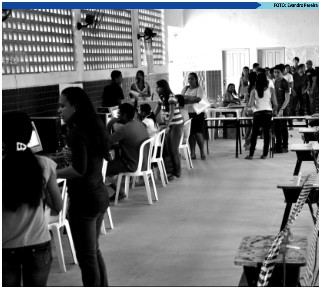
As inscrições para o Vestibular da UFPB podem ser feitas até amanhã e o pagamento até segunda-feira

As vagas para o CFO são distribuídas entre o Corpo de Bombeiros e a Polícia Militar, sendo 30 para PM masculino, 5 para PM feminino, 11 para CB masculino e 4 para CB feminino. Os candidatos que pre-