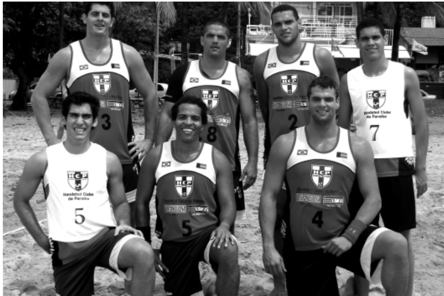
O HCP é um dos representantes da Paraíba e, com 6 atletas na Seleção Brasileira, é favorito a conquistar o título da etapa de João Pessoa

O Circuito Brasileiro de Handebol de Areia Adulto Feminino e Masculino terá organização da Confederação Brasileira de Handebol com apoio da Federação Paraibana de Handebol.