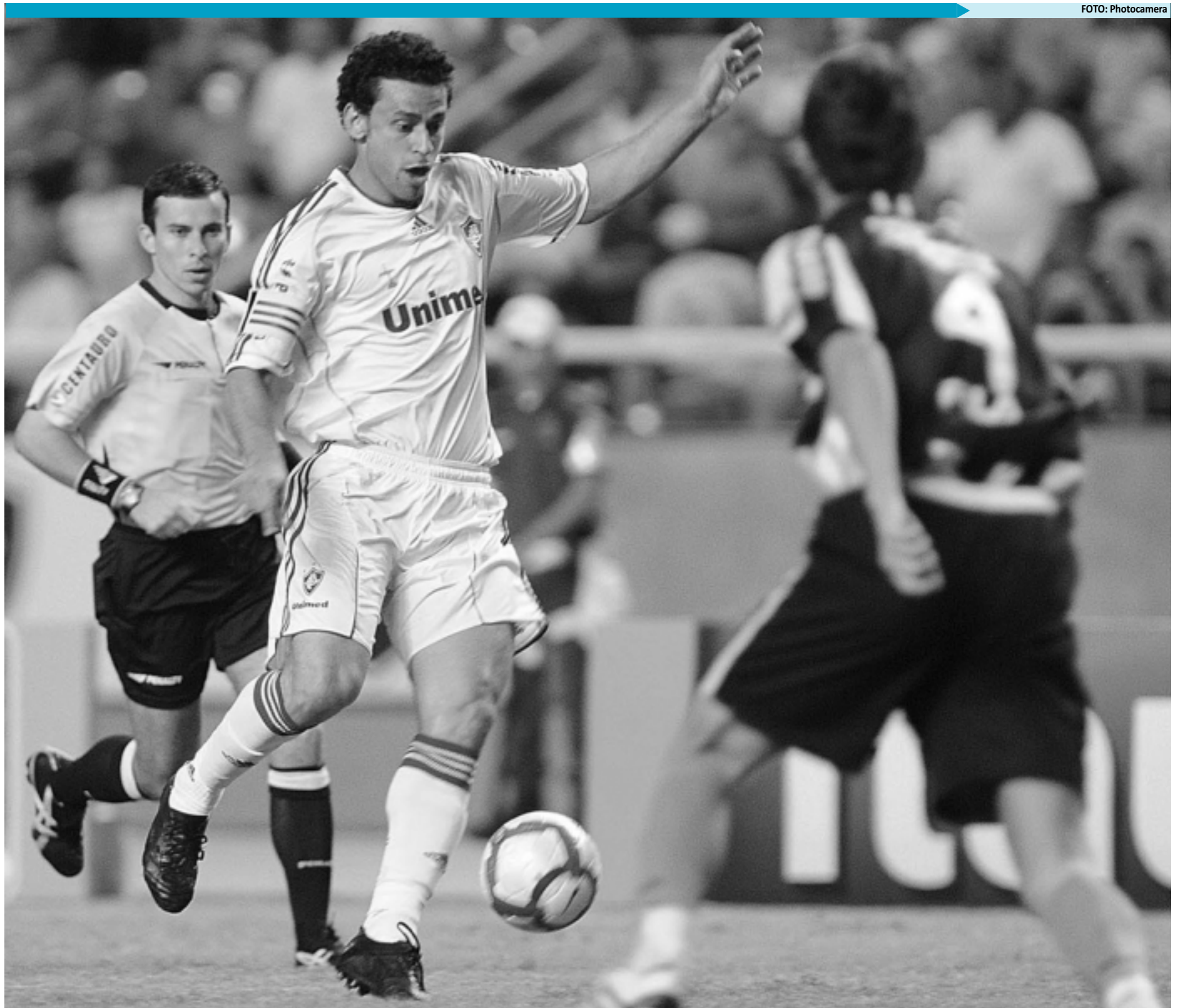
Fluminense e Botafogo fazem mais um grande clássico do futebol brasileiro na última rodada da fase classificatória que prevê outros tradicionais em diversos estados do país hoje e amanhã

"É um jogo em que eu considero fundamental o papel do torcedor para incentivar esse jogadores, que merecem um apoio. É um clássico, e na sequência você tem um Palmeiras, que é um confronto direto. É um momento crucial e fundamental para uma luta pelos primeiros lugares. A gente está terminando o 1º turno com 31 pontos, uma pontuação muito boa. É um