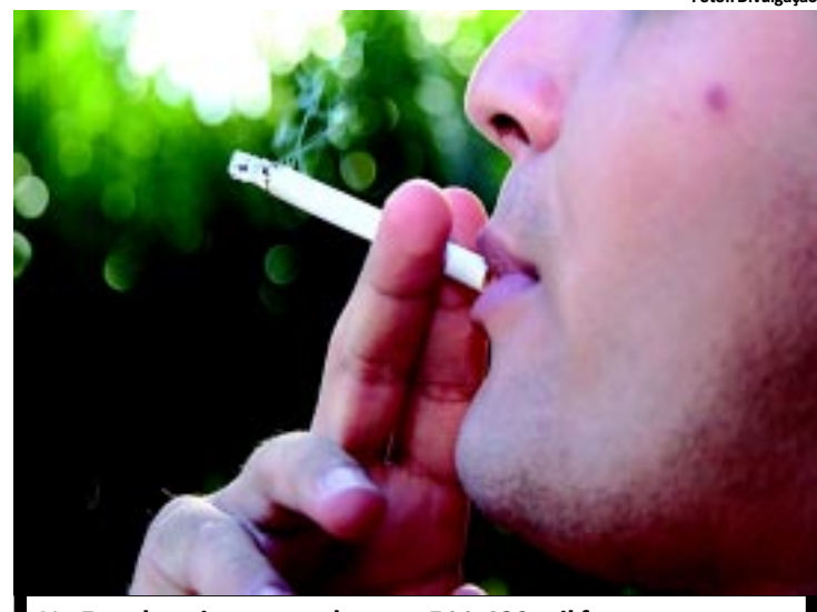
No Estado existem atualmente 511.480 mil fumantes