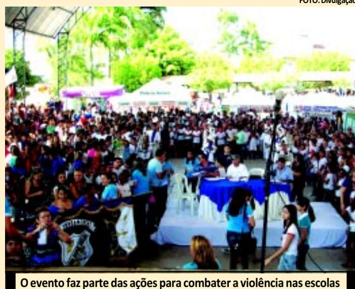
O evento faz parte das ações para combater a violência nas escolas