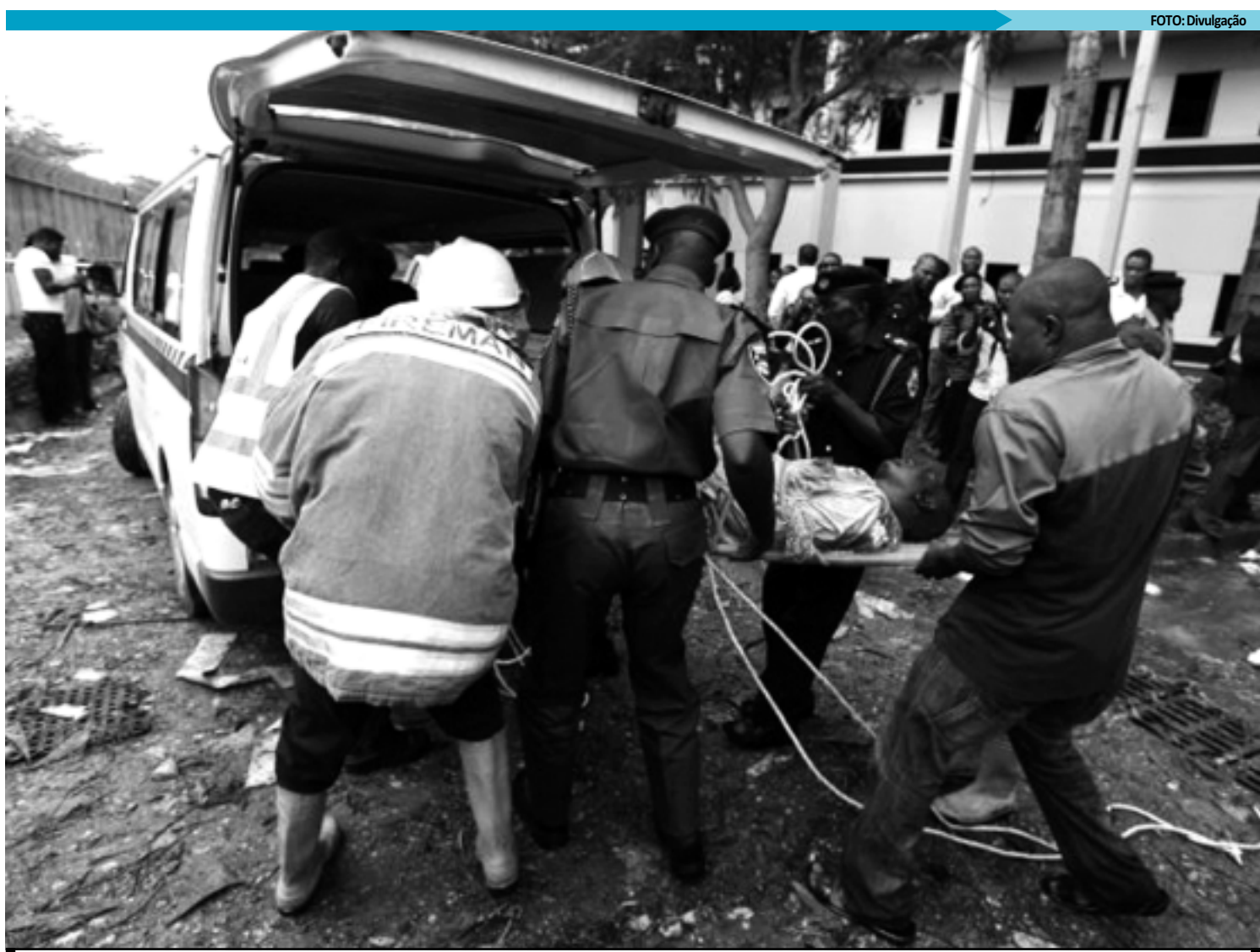
Equipe de resgate socorre pessoas que foram vítimas da explosão de uma bomba no edifício da Organização das Nações Unidas, no país africano

Seita assume atentado - Abuja (AE) - O porta-voz de uma seita radical muçulmana na Nigéria, conhecida localmente como Boko Haram, assumiu a responsabilidade pelo atentado com carro-bomba contra os escritórios da Organização das Nações Unidas na Nigéria. O porta-