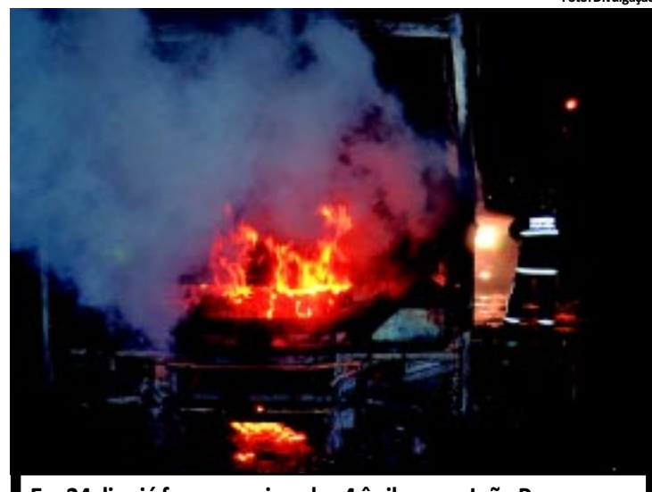
Em 24 dias já foram queimados 4 ônibus em João Pessoa

O número de mortes em decorrência de câncer de esôfago, laringe e pulmão, motivados pelo tabagismo, apresentou uma queda de 19,21% este ano. Na próxima segunda, é celebrado o Dia Nacional de Combate ao Fumo. Na Paraíba, a Secretaria de Estado da Saúde desenvolverá uma programação com ações educativas e preventivas, alertando sobre o problema, com foco nos adolescentes. Atualmente, existem 511.480 paraibanos fumantes. PÁGINA 9