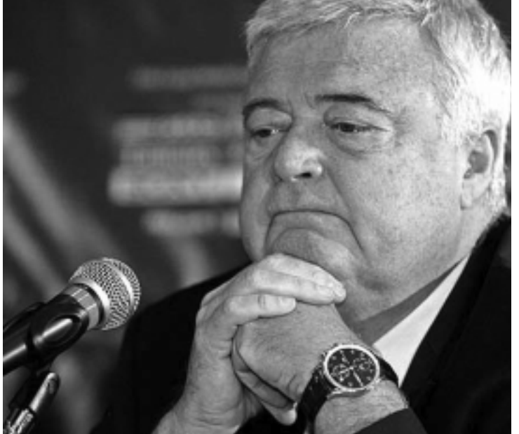
Presidente do Comitê da Copa continua sendo alvo de várias denúncias