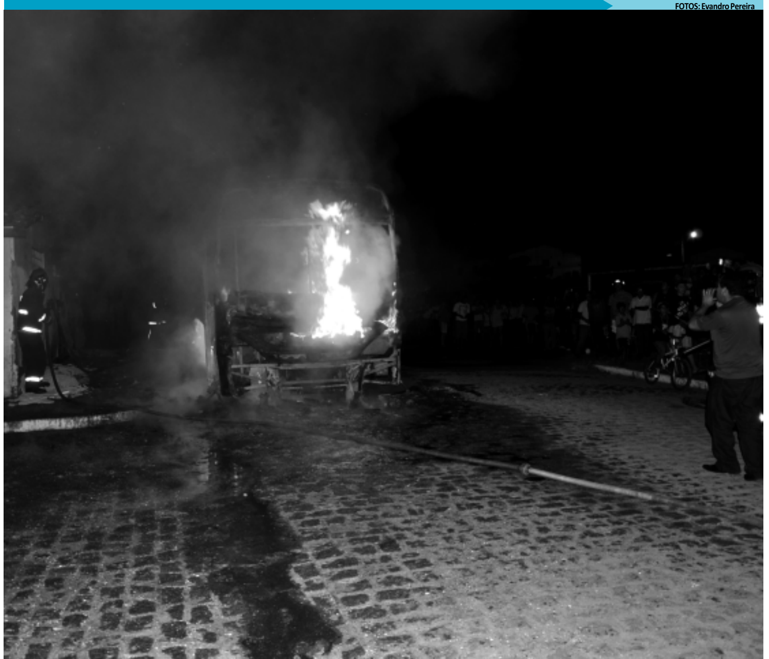
Dois ônibus, um da empresa São Jorge e outro da Reunidas, foram incendiados na Capital. No total, já são quatro veículos queimados em 24 dias

OUTROS CASOS - No último dia 2, outros dois ônibus, ambos da Empresa São Jorge, foram queimados no Conjunto Valentina Figueirêdo, Região Sul da Capital, quando desconhecidos invadiram os veículos e, após assaltarem passageiros, mandaram todos descerem e em seguida atearam fogo. O caso aconteceu no loteamento Boa Esperança, no Conjunto Valentina Figueirêdo. Segundo um dos passageiros, um dos bandidos chegou a dizer que aquele era o primeiro ônibus a ser incendiado e que outros teriam o mesmo destino.