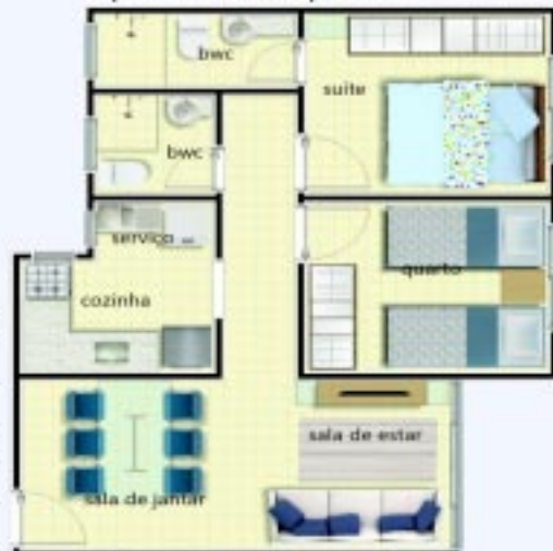
Apartamento tipo 02