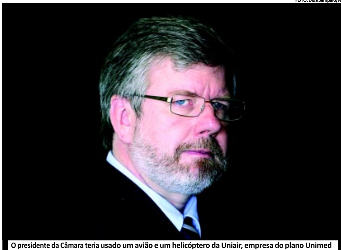
O presidente da Câmara teria usado um avião e um helicóptero da Uniair, empresa do plano Unimed

Da mesma fonte salarial, saiu, segundo ele, o pagamento de outra viagem, no dia 4 de junho, de Brasília para Goiânia e, de lá, para Porto Alegre. A reportagem tem a informação de que Maia fretou outros dois aviões durante o ano, em 29 de abril e 24 de junho, mas ele recusa-se a comentá-la. Em entrevista à Rádio Gaúcha ontem, o deputado do PT afirmou que a viagem do último sábado, pela Uniair, custou de R$ 15 mil a R$ 16 mil, depois de dizer ao Estado que os valores seriam de R$ 3 mil a R$ 4 mil.